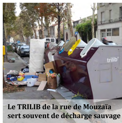
Le TRILIB de la rue de Mouzaïa sert souvent de décharge sauvage

Pour faire enlever ses encombrants par la ville de Paris c'est simple et gratuit Il suffit de prendre rendez-vous à l'adresse suivante : https://teleservices.paris.fr/ramen